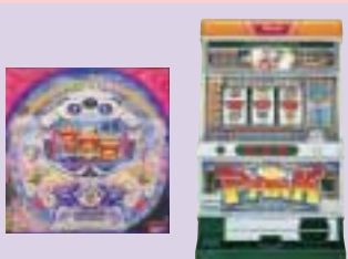
C R かつば 6 F タイムパーク