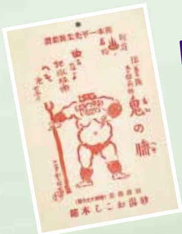
岡本太郎さんの父 岡本一平氏のイラスト入りの飴のパッケージ