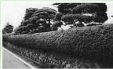
田の湯旅館街の石垣