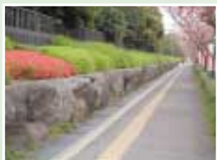
現在の別府公園の石垣