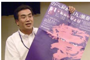
▲ 今年のポスターが完成