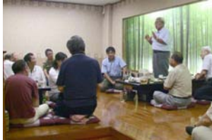
▲ 大盛況の「おのこの会」